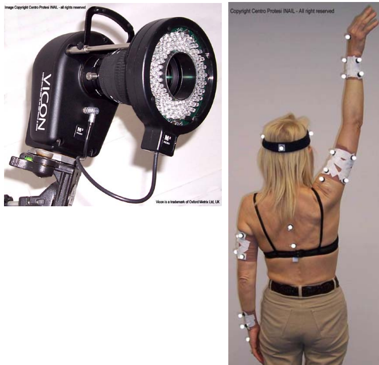
Fig 1: telecamera di un sistema stereofotogrammetrica e preparazione della paziente per l'esame

Le scale Constant e ASES sono comunemente utilizzate in riabilitazione per quantificare il danno alla spalla. Entrambe valutano aspetti importanti, quali il dolore, l'ampiezza del movimento e la potenza. Tuttavia, non contemplano alcun item per monitorare il recupero della normale coordinazione fra movimenti dell'omero e del cingolo scapolare (ovvero del ritmo cingolo-omerale ), aspetto importante in riabilitazione. Per questo motivo è stato messo a punto un protocollo basato su stereofotogrammetria, dal nome Total 3D Upper Limb (fig. 1), che permette di misurare durante un qualunque atto motorio i movimenti di flessione-estensione, ab-adduzione ed intra-extrarotazione dell'omero rispetto al cingolo scapolare, ed i movimenti di ante-retropulsione ed elevazione-abbassamento del cingolo rispetto al torace. Osservando l'evoluzione dei movimenti del cingolo in funzione dei movimenti dell'omero, è possibile avere una misura diretta del ritmo cingolo-omerale (fig. 2).